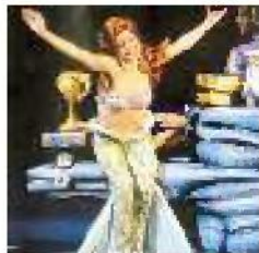
LA SIRENETTA Un viaggio nelle profondità oceaniche con Ariel e la strega Ursula