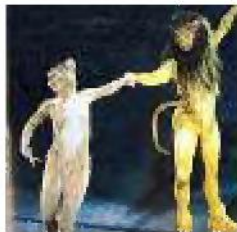
RE LEONE Avventure nella savana africana con il leone Simba

Topolino e Paperino guidano il pubblico in un viaggio attraverso quattro classici interpretati da 40 pattinatori