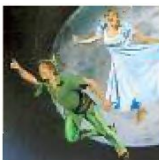
PETER PAN I protagonisti arrivano sull'Isola che non c'è dove trovano Peter e Capitan Uncino