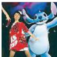
LILO & STITCH L'avventura della triste Lilo che fa amicizia con l'extraterrestre Stitch