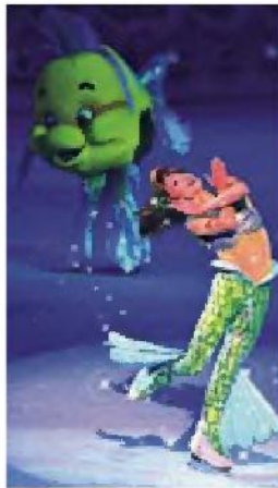
Profondità La Sirenetta

Cento artisti volteggiano sulle note di 4 fiabe, da Lilo & Stitch alla Sirenetta